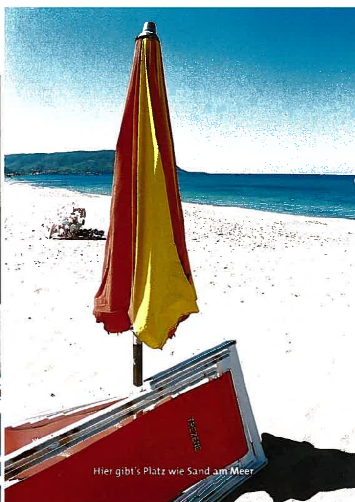
Hier gibt's Platz wie Sand am Meer