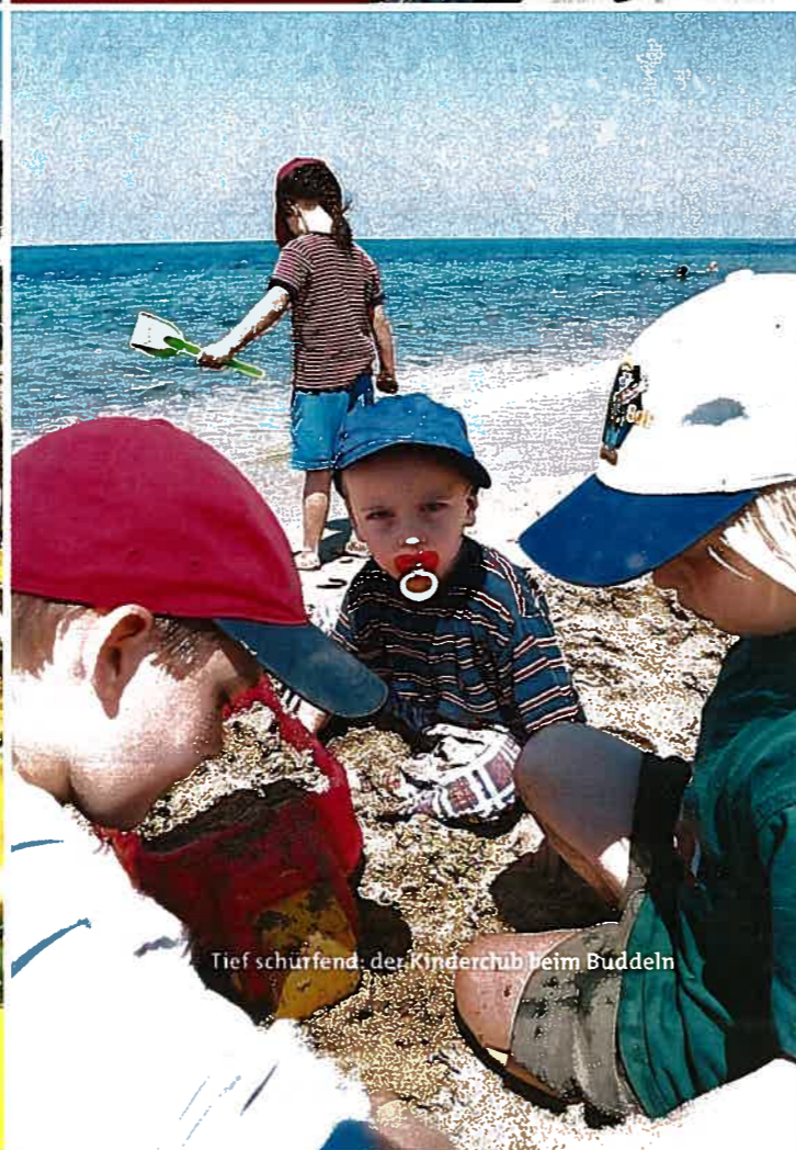
Tief schürfend: der Kinderclub beim Buddeln