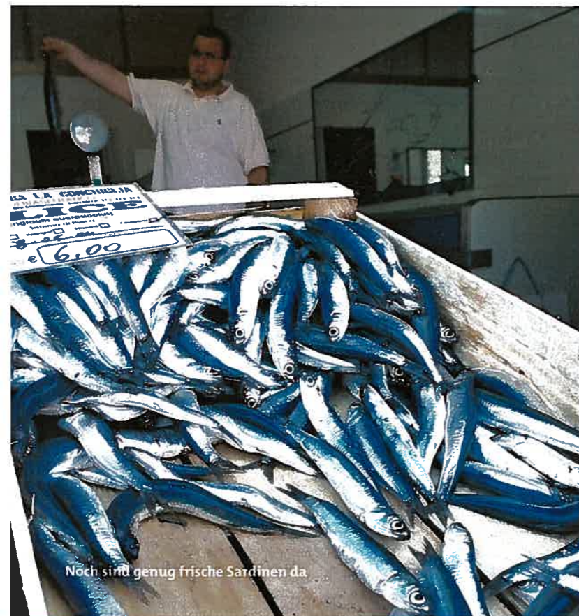
Noch sind genug frische Sardinen da