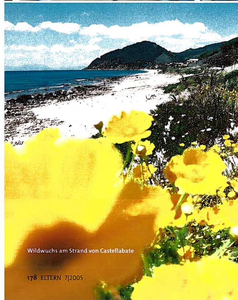
Wildwuchs am Strand von Castellabate