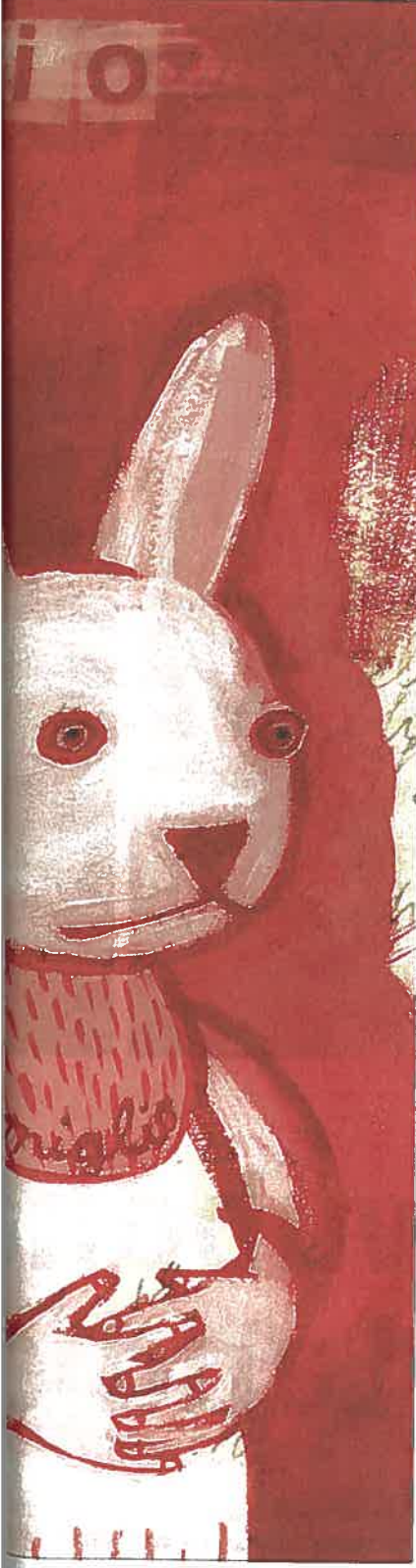
... sind entnommen aus „La nonna, im Gerstenberg Verlag.