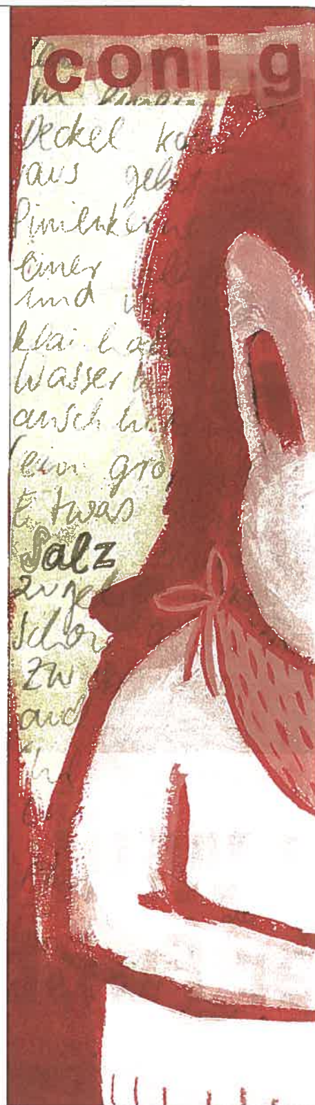
Die Zeichnungen von Larissa Bertonasco „la cucina, la vita“, erschienen

Bald werden die Kinder nach einem Rezept der Oma Apfelkuchen backen und mit Gewürzen statt Farben Phantasietiere entwerfen. Oder auf ein riesiges Gruppenbild mit Tusche und Pastellkreiden das eigene Lieblingsessen malen.