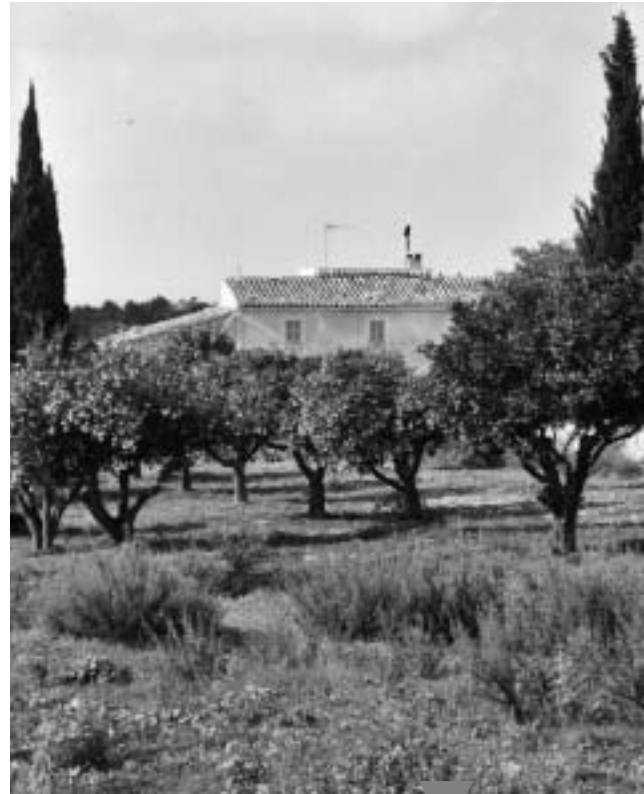
Die vamos -Finca C'an Martorell

Finca-Ferien auf italienische Art versprechen unsere neuen, exklusiven vamos -Ziele San Giuseppe in der Toscana (6 Whn.) und Le More e i Gel-Somini am Lago Trasimeno (9 Whn.) ab Ostern 2002.