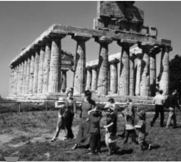
Kinderbetreuung in Paestum (Süditalien)

„Die Mitarbeiterinnen und Mitarbeiter sind unser wichtigstes Kapital!“, so lautet der neunte Punkt des vamos -Leitbildes. Entsprechend groß ist unser Einsatz, gute MitarbeiterInnen zu finden und sie zu betreuen.