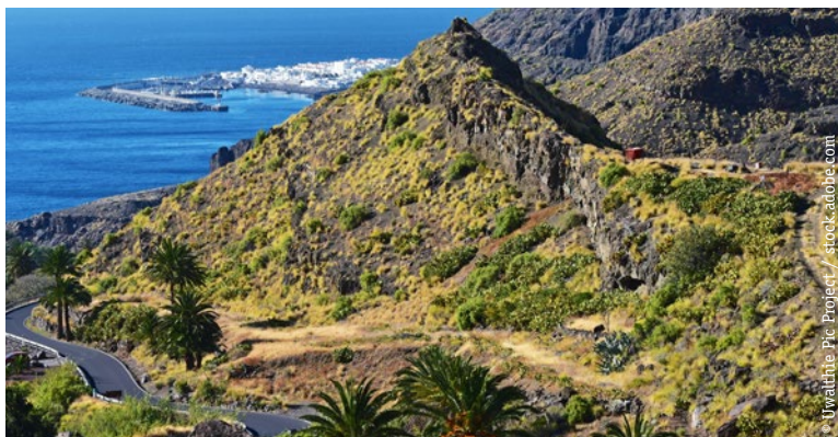
STRAND VON PUERTO DE LAS NIEVES (4 KM)