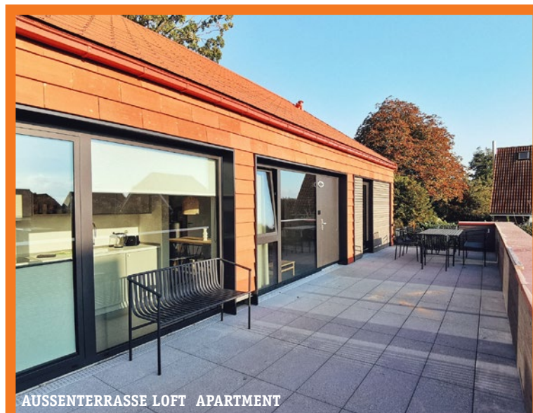
AUSSENTERRASSE LOFT APARTMENT