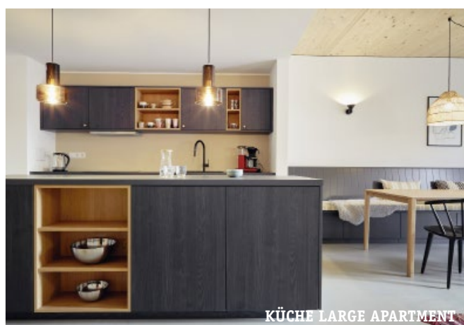
KÜCHE LARGE APARTMENT

LEISTUNGEN Übernachtung inkl. Bettwäsche, Handtücher. Ladestation für E-Autos. Waschmaschine (außer in App. Medium). 1 Bollerwagen/Aufenthalt. Pkw-Stellplatz am App. WLAN. NEBENKOSTEN Ortstaxe 1,50 €-2,50 €/Tag/Pers. ab 18 J. EXTRAS Weiteres Handtuchset 6,50 €. Hunde 10 €/Tag. WECHSELTAG tägl. Anreise auf Anfrage möglich, Mindestbuchungszeit 4 Übernachtungen, 27.06.-02.09. 7 Übernachtungen. ANREISE Bushaltestelle Hohwacht Berliner Platz (ca. 500 m). HINWEISE Zustellbett, Hochstuhl, Babyreisebett auf Anfrage. Hundekissen und -napf kostenlos auf Anfrage. Restaurant ca. 500 m, Strand ca. 750 m.