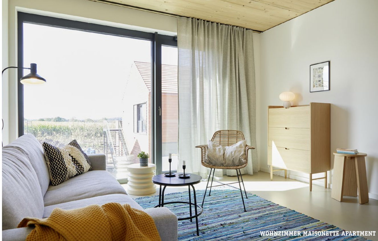
WOHNZIMMER MAISONETTE APARTMENT