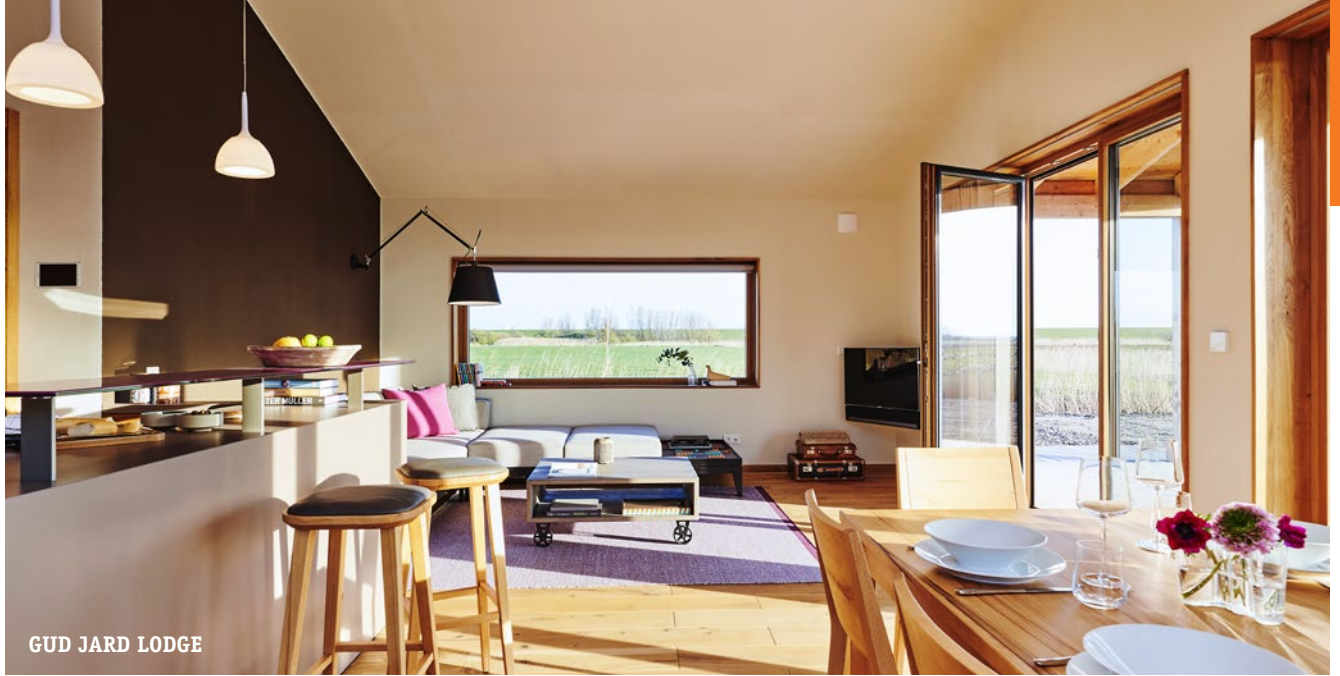
GUD JARD LODGE