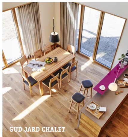
GUD JARD CHALET