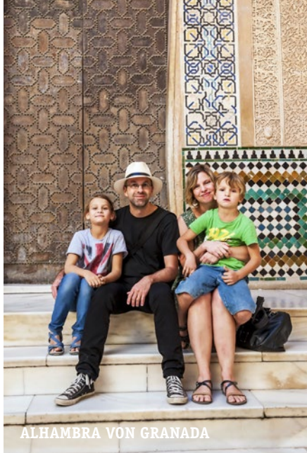
ALHAMBRA VON GRANADA