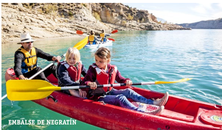
EMBALSE DE NEGRATÍN