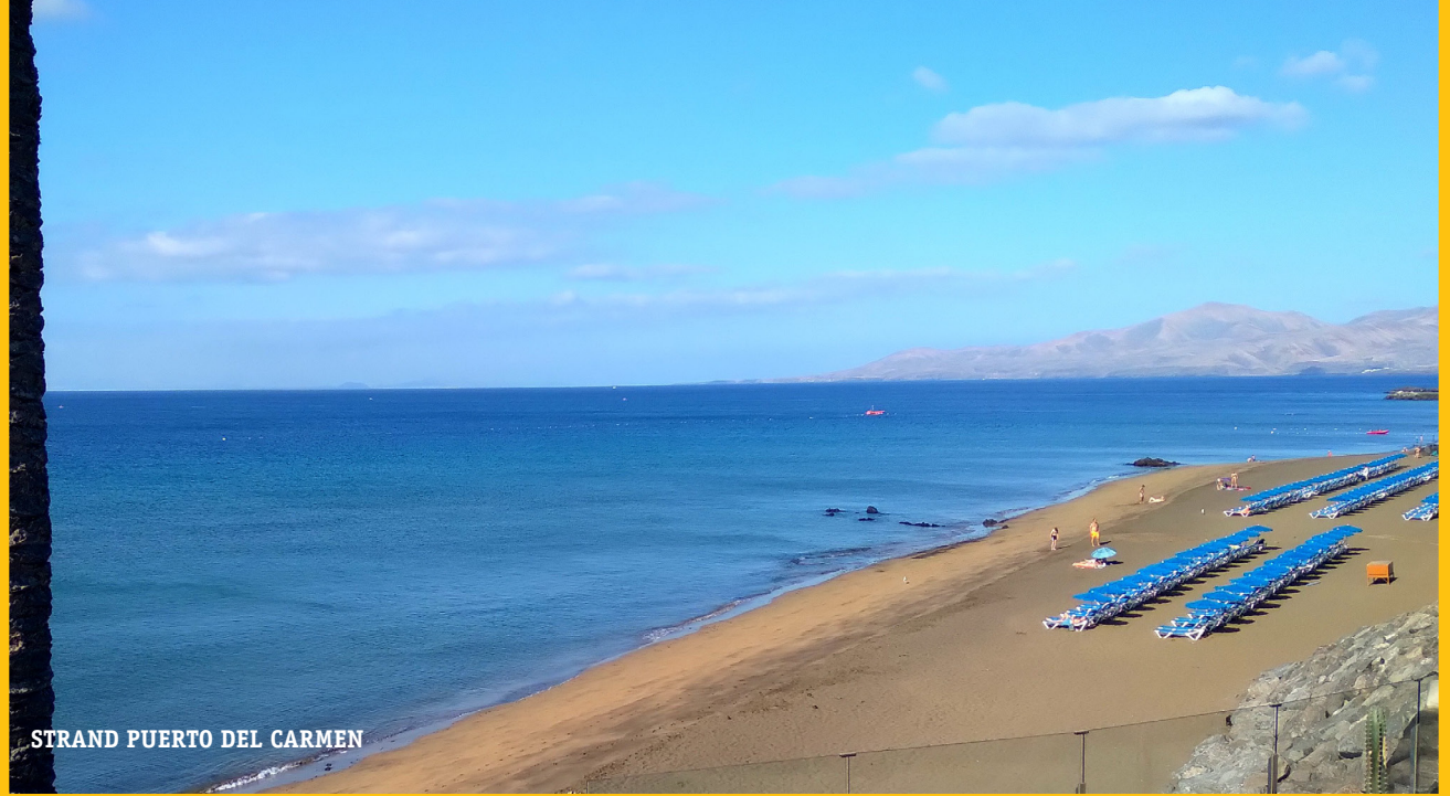
STRAND PUERTO DEL CARMEN