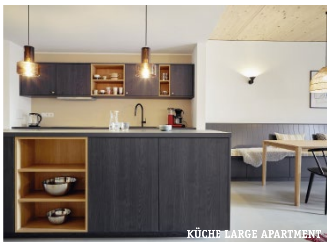
KÜCHE LARGE APARTMENT