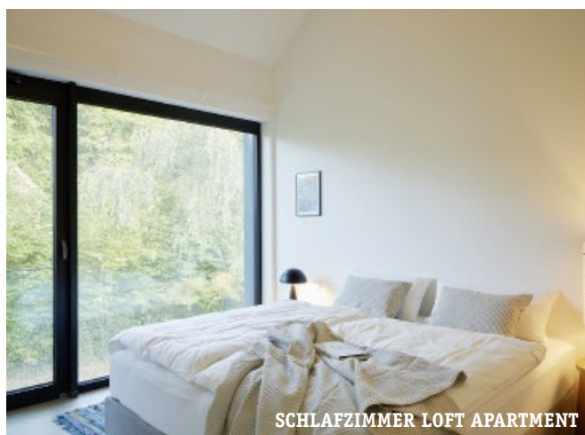
SCHLAFZIMMER LOFT APARTMENT

Ganz nach dem Motto „Golfen mit Meeresbrise“ kommt in De ole School jeder auf seine Kosten, denn nur knapp 3 km entfernt liegt die Golfanlage Hohwacht mit 9-Lochplatz und mit einem 18-Lochplatz.