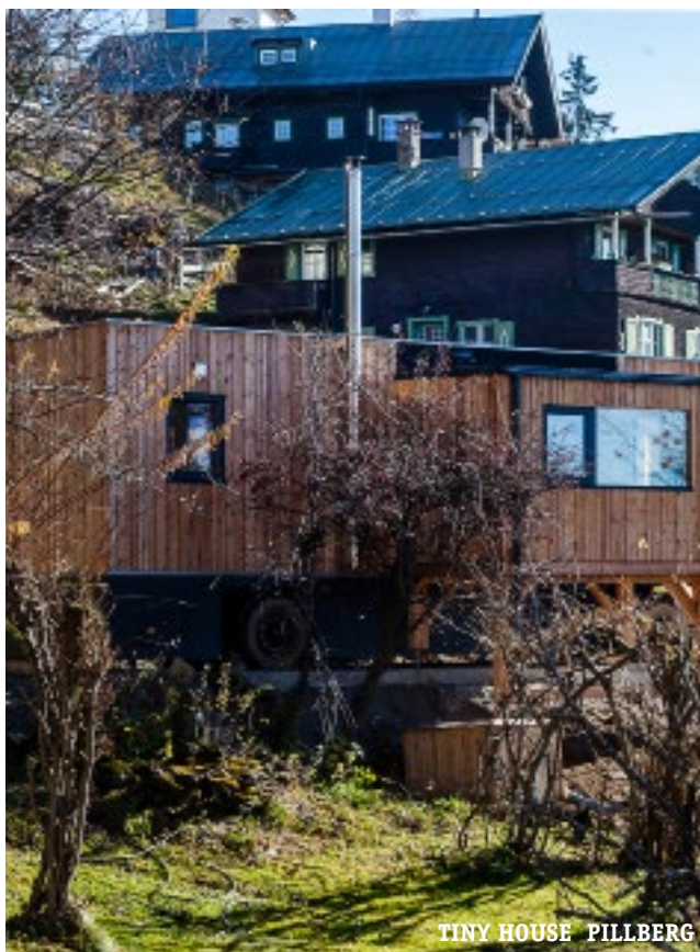
TINY HOUSE PILLBERG