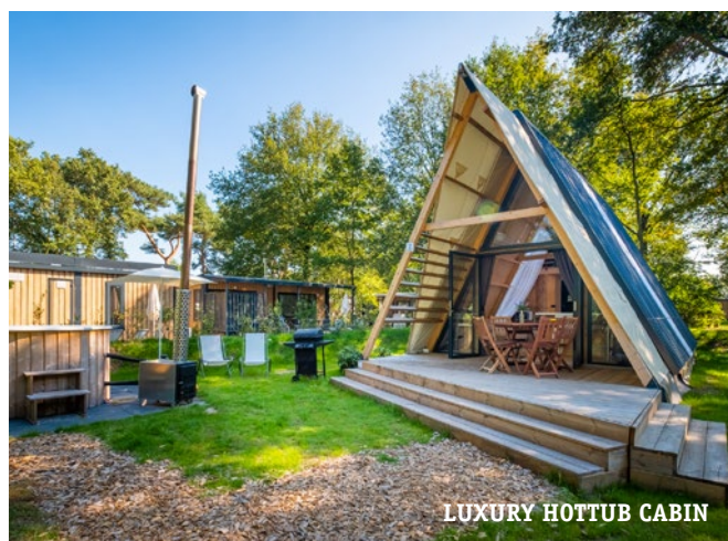
LUXURY HOTTUB CABIN