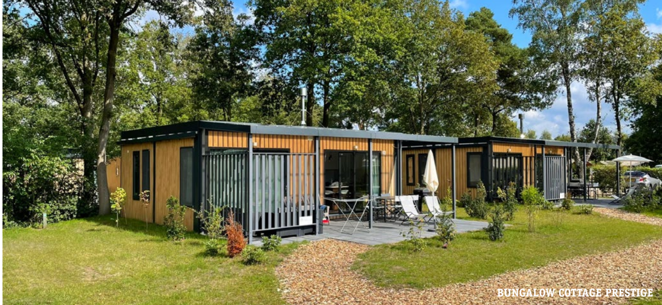
BUNGALOW COTTAGE PRESTIGE