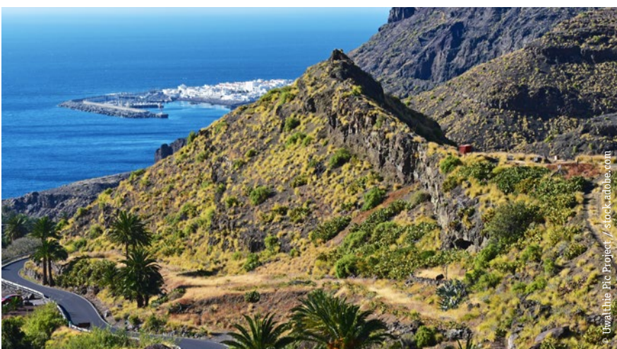
STRAND VON PUERTO DE LAS NIEVES (4 KM)